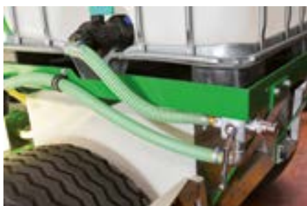
Aspiration eau extérieure avec filtre Aspiration externe