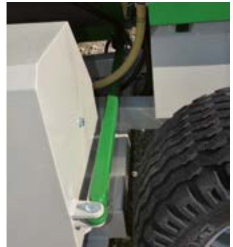
Automatisme contrepoids (Série)

L'acheteur est responsable pour une homologation routière selon la réglementation de son pays. Merci de contacter nos conseiller.