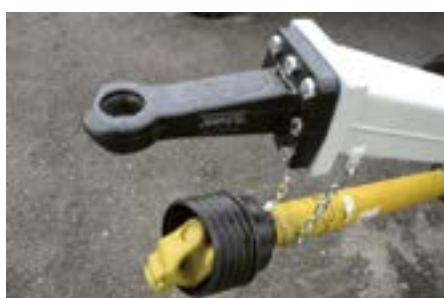
Équipe œillet standard (DIN)