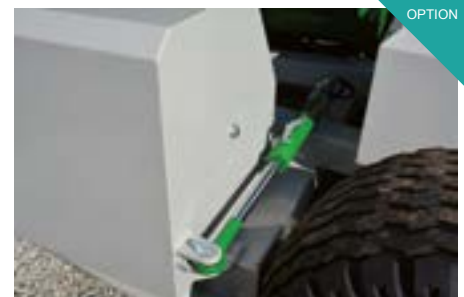
Contrepoids déplaçable hydrauliquement