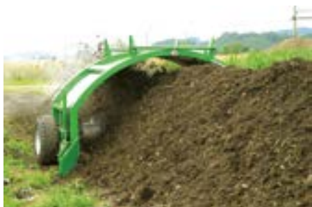
Taille maximale des andains de 3m x 1.5m pour un compostage aérobie.