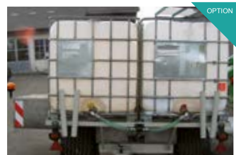
Double réservoir d'eau