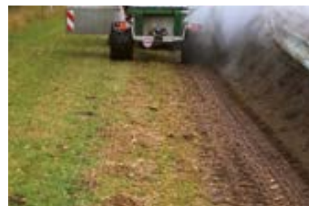
La construction en arc très massive en acier de 6 mm garantit une très bonne résistance. En plus la répartition du poids est optimale et réduit le poids total de 1500 kg.