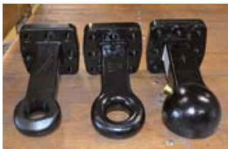
DIN (Série) Piton K80