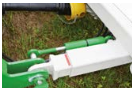
Déport hydraulique pour garder l'andain la ou il faut.