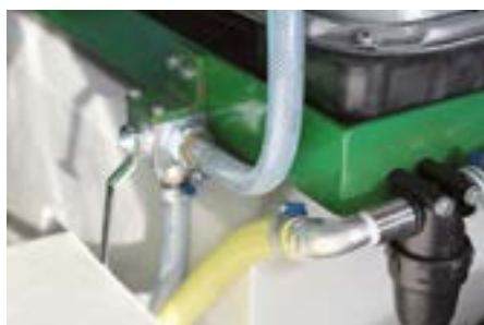
Filter à eau