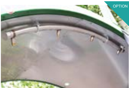
Dispositif d'irrigation avec buses. Double réservoir d'eau. Pour obtenir un climat optimal pour les microorganismes dans l'andain un apport d'eau est essentiel.