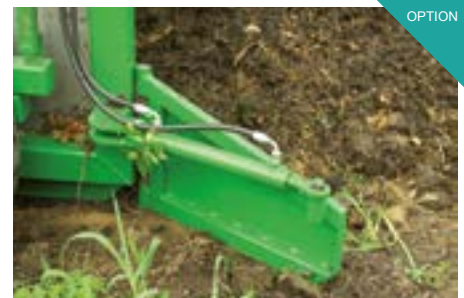
Panneau de ramassage hydraulique