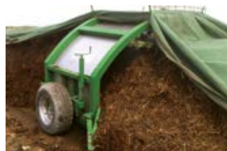
La bâche est ramené sur une petite largeur pour laisser les gazes s'échapper. Le travail physique avec des baches humides est ainsi évité.