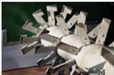
Un bon rotor travaille la matière de l'intérieur vers l'extérieur pour optimiser les conditions de vie des microorganismes.