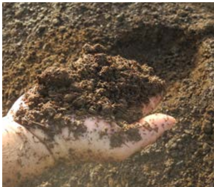
Fumier de cheval après 5 semaines

Avec le TG 301 le compostage est facile et rapide. Ceci surtout grâce au rotor qui travaille à la perfection et mélange le matériel de l'extérieur vers l'intérieur.