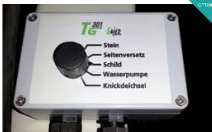
Utilisation facile à travers un boîtier de commandes. (Option) Commande à l'aide d'électrovannes.