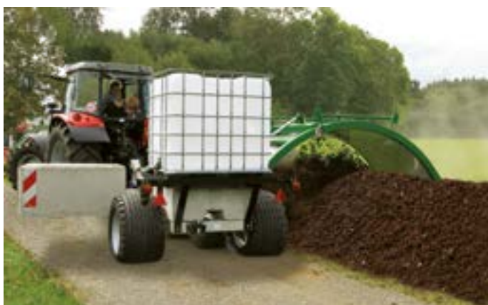
Contrepoids dépliant (respectueux pour les chemins)