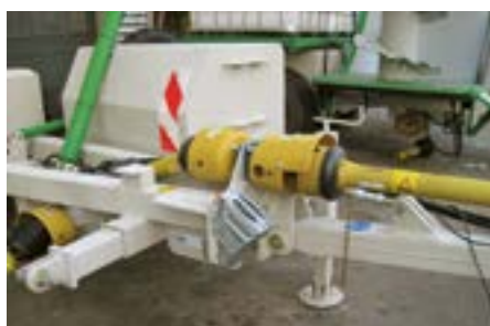
Attelage sur piton ou K80