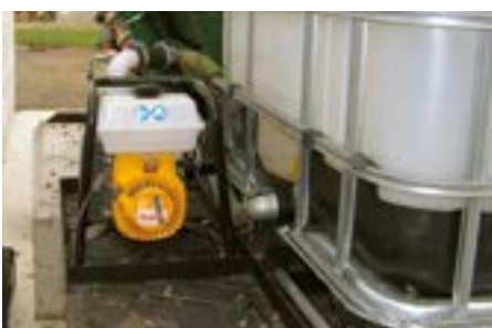
Les retourneurs sont conçues d'une façon à permettre d'installer des pompes à eau individuelles.