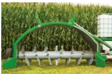
La construction en arc très massive en acier de 6 mm garantit une très bonne résistance