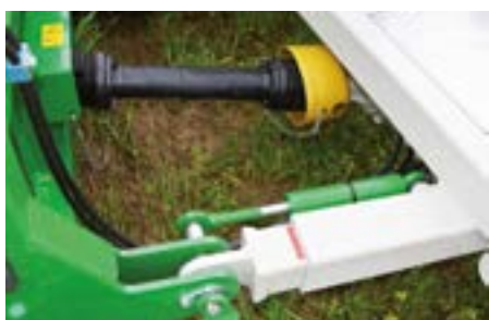
Entrainement direct grâce au réducteur sur le rotor