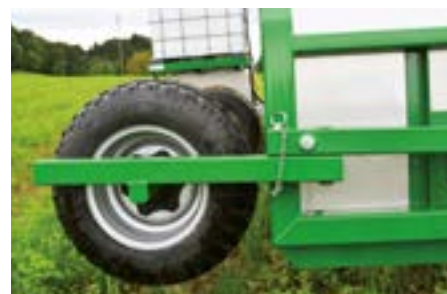
Pour le transport la roue de support peut être repliée. Pas de démontage nécessaire