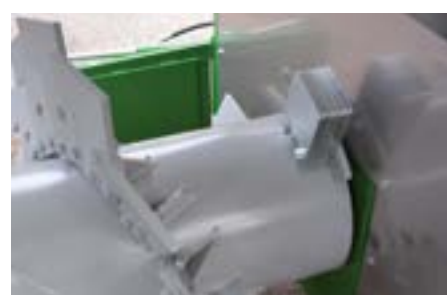
Lames en acier 12 mm fixés avec 3 boulons. L'équilibrage du rotor garantit une longue longévité.