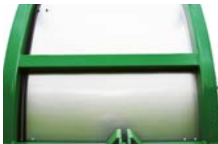
Toutes les tôles d'usure sont en acier chromé.