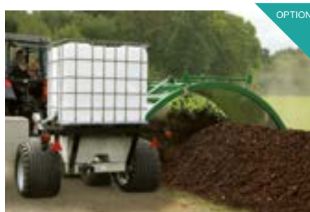
Système d'irrigation complète