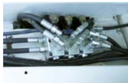
Boîtier de distributions avec electrovannes (simple, double ou triple)