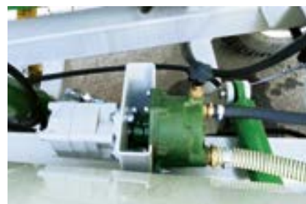
Pompe à eau