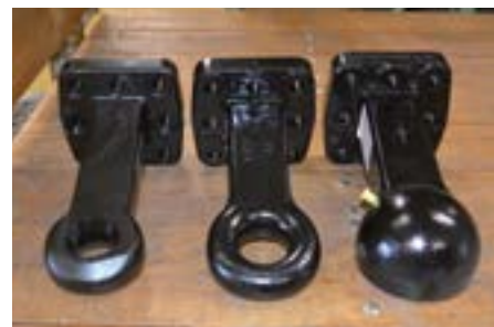
DIN (Serie) Piton K80