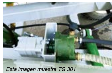
Esta imagen muestra TG 301