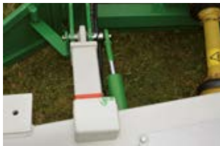
Sistema hidráulico de inclinación del túnel, para que la pila se quede en el sitio dónde pertenece.