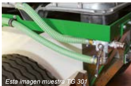
Esta imagen muestra TG 301