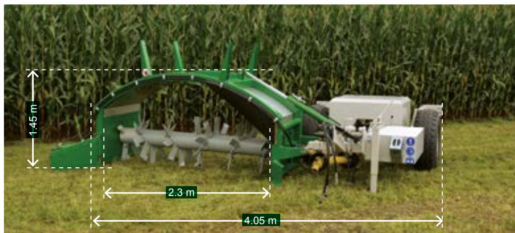
Posición de trabajo