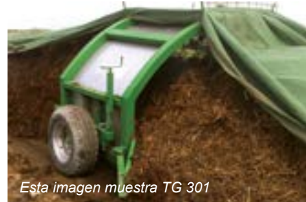
Esta imagen muestra TG 301