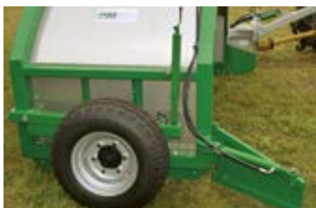
Placa de alimentación hidráulica derecha