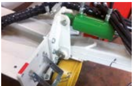
Lanza articulada hidráulica