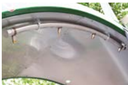
Barras aspersión de agua con pulverizadores. Para la obtención de un clima óptimo para los microorganismos dentro de la pila, la adición de agua es indispensable.