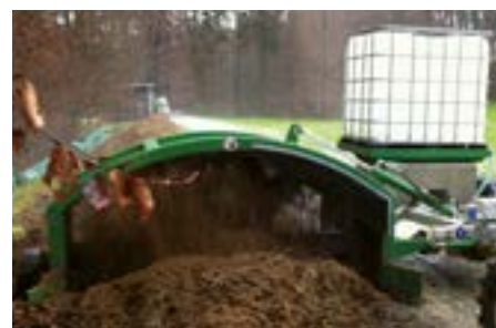
Sistema de riego completo