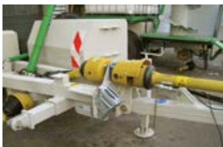
Dispositivo de remolque para tracción baja