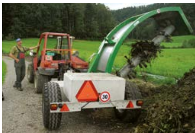
Después del trabajo se puede poner el túnel cómodamente en la posición de transporte