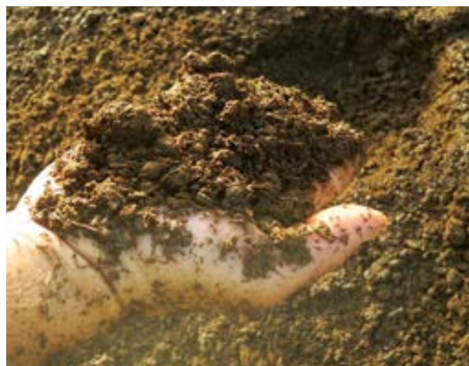
Estiércol de caballo después de 5 semanas.

Con la TG 231 se consigue fácilmente y rápidamente un compostaje exitoso. Esto se debe en gran parte al eje de volteo que trabaja perfectamente y que mueve el material desde el interior hacia el exterior.