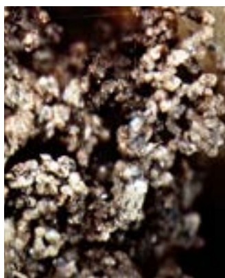
Perfecta estructura de grumo – vista microscópica

Además, un suelo rico en humus almacena CO 2 de forma natural, lo que protege nuestro clima.