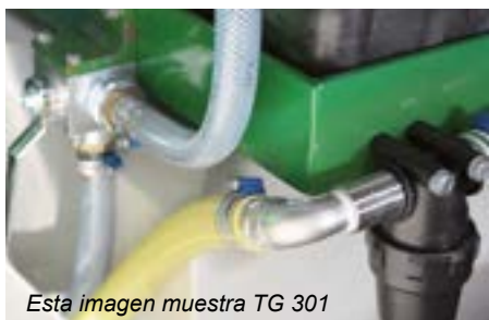
Esta imagen muestra TG 301