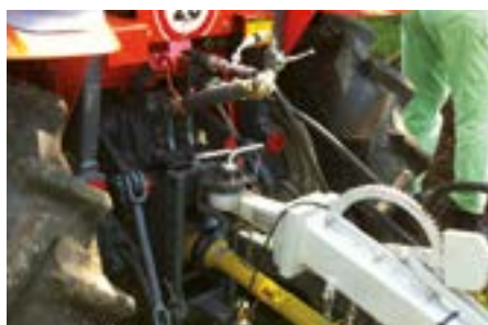
Posición flotante. En caso de que el tractor no disponga de ella.