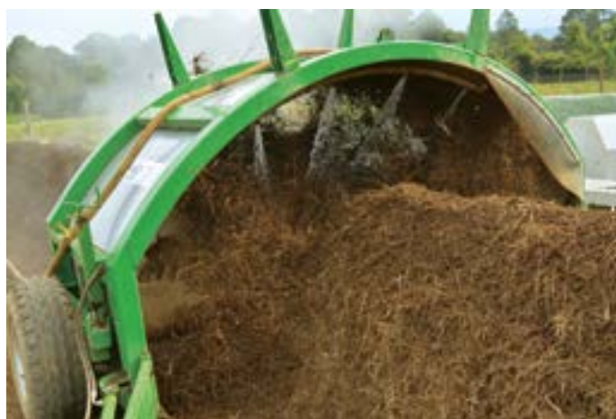
Sistema de riego