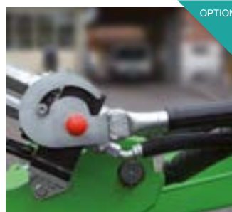
Raccord hydraulique rapide pour chargeur compact