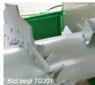
Bild zeigt TG301

Taille maximale des andains de 2m x 1m pour un compostage aérobie.