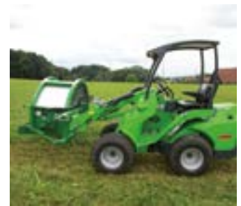
Posición de trabajo