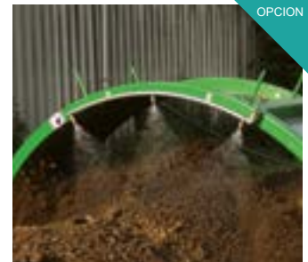
Barras aspersion de agua con pulverizadores. Para la obtención de un clima óptimo para los microorganismos dentro de la pila, la adición de agua es indispensable.