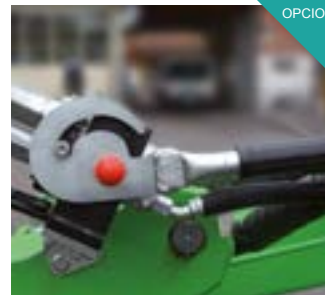
Acoplamiento rápido hidráulico para cargadoras compactas