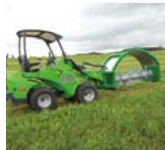
Posición de transporte